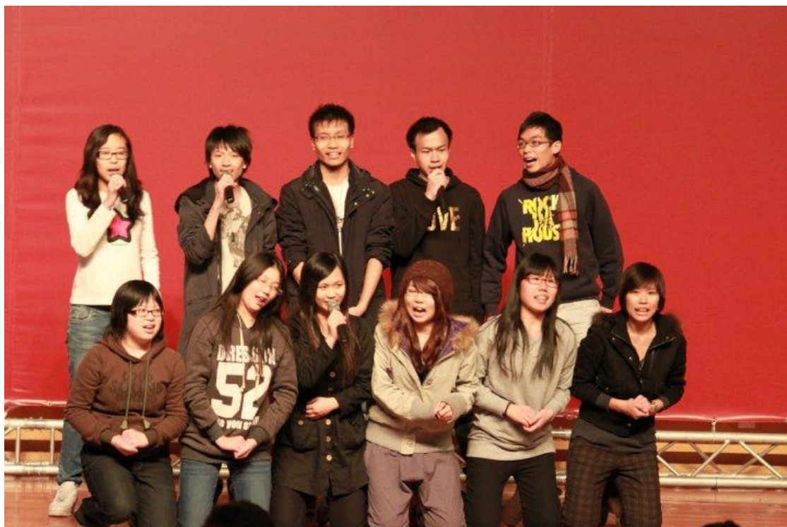
我們在與民族大學表演晚會中的精彩演出！